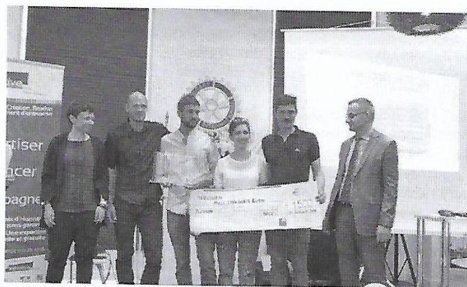
Le prix spécial du commerce.