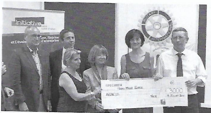
Le prix spécial du Rotary récompense AVENCOD.